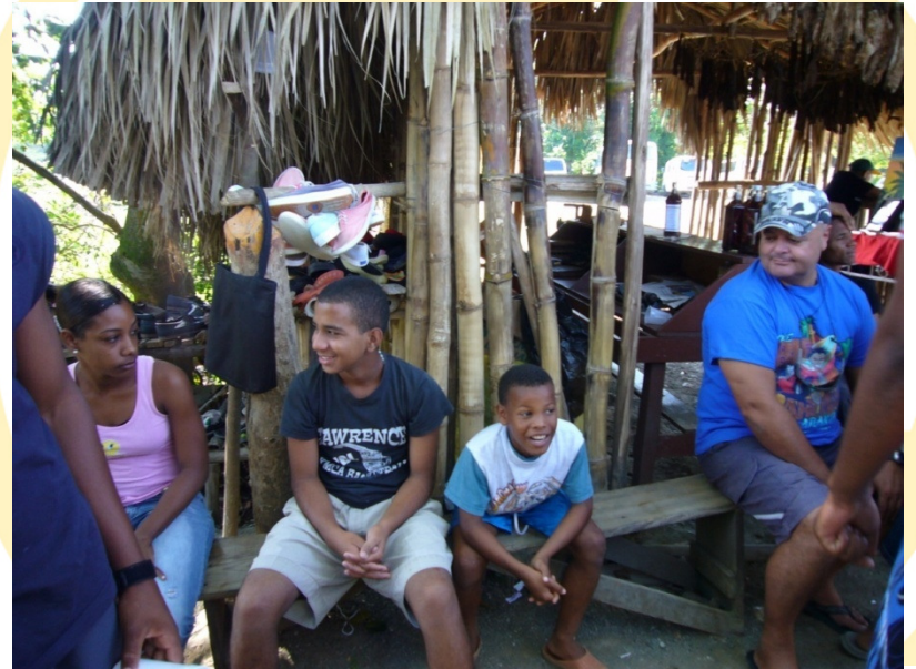
Guías de los Charcos de Damajagua esperan la llegada de los turistas para excursión.